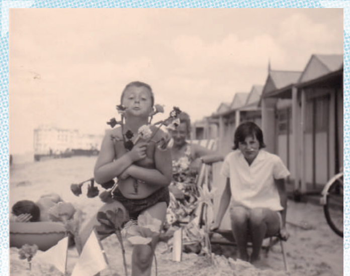
Middelkerke - ca. 1965