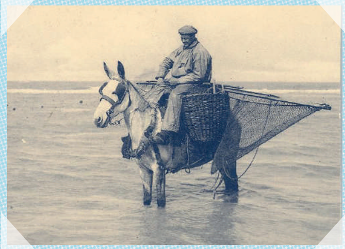
De Panne