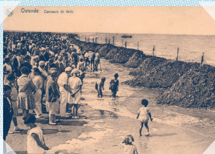
Oostende - ca. 1930