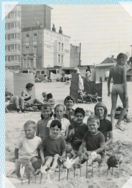
Oostende - 1966