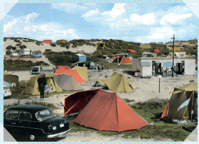
Lombardsijde - 1931