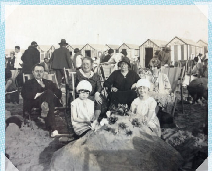
Heist - 1931