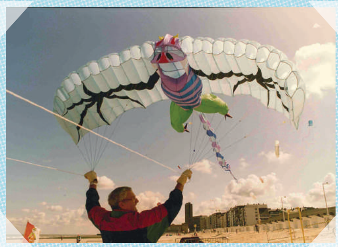
Oostende - ca. 1995