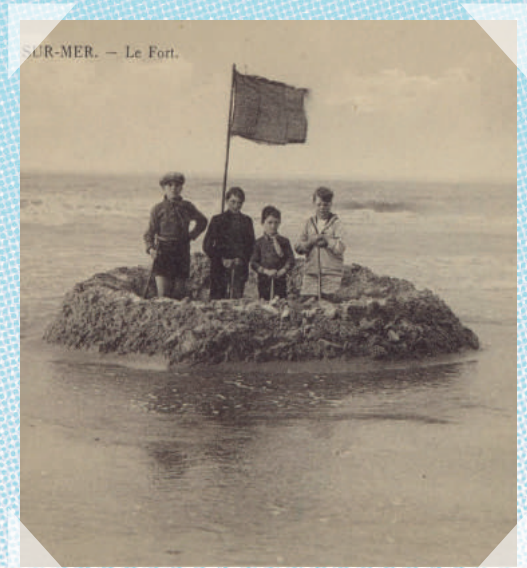
De Haan - ca. 1905