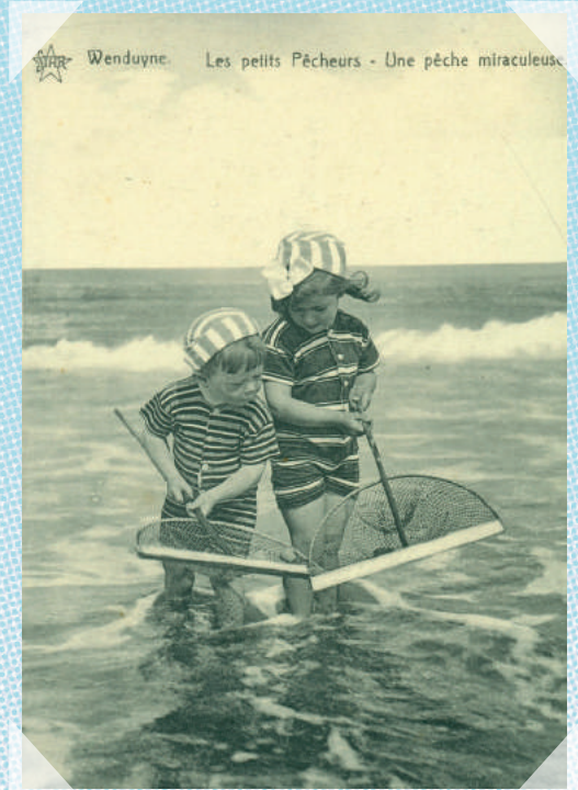
De Haan - ca. 1905