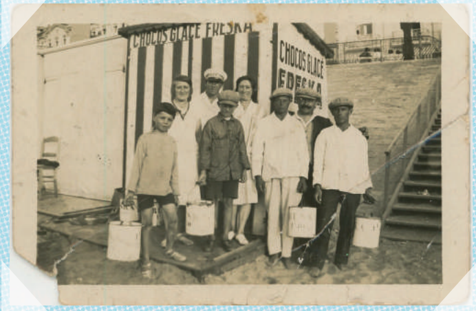
Blankenberge - ca. 1930