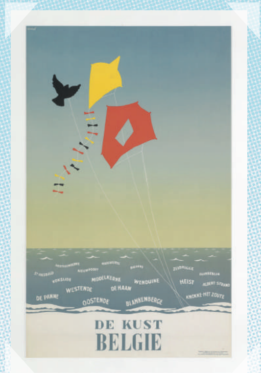
De Kust - 1955 AFFICHE FREDDY CONRAD