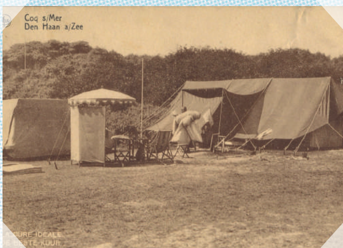
De Haan