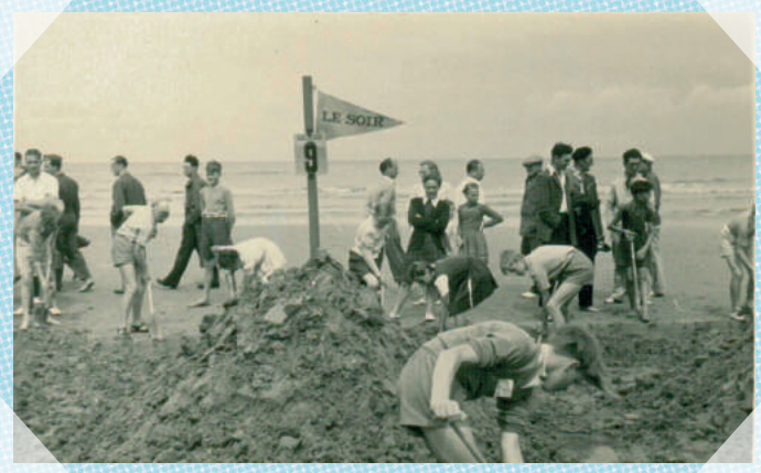
Middelkerke - 1955 COLLECTIE GEMEENTE MIDDELKERKE