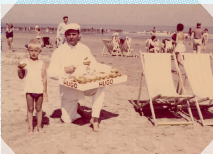
Blankenberge - ca. 1970