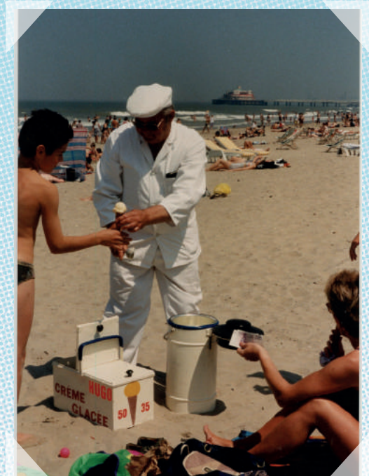
Blankenberge - ca. 1995