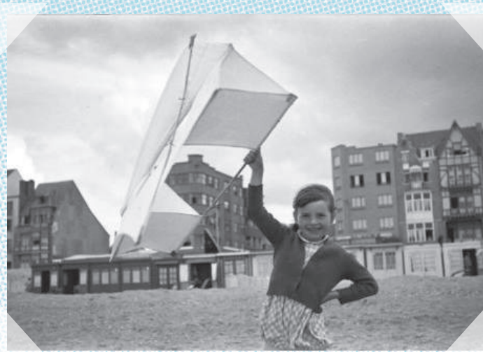
Koksijde - ca. 1948 WESTHOEK VERBEELDT