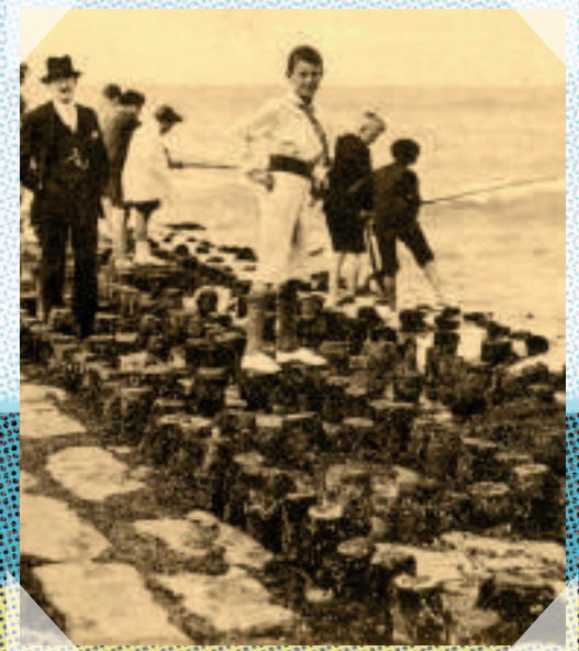
Blankenberge - ca. 1905