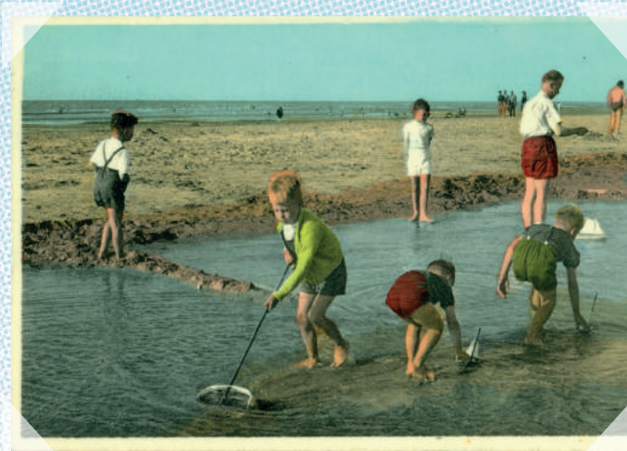
Wenduine - ca. 1975