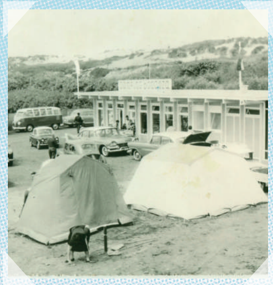
De Haan - ca. 1965