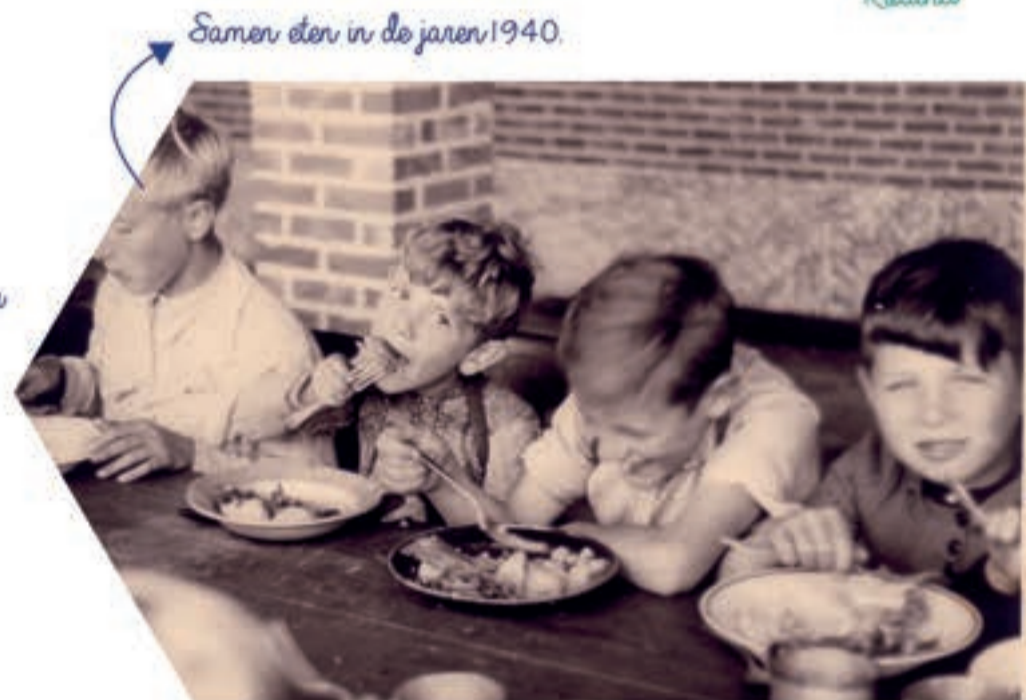
Samen eten in de jaren 1940.

kerrepap met suiker en een sneetje brood