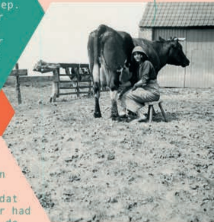
Collectie Halmyck - Sja