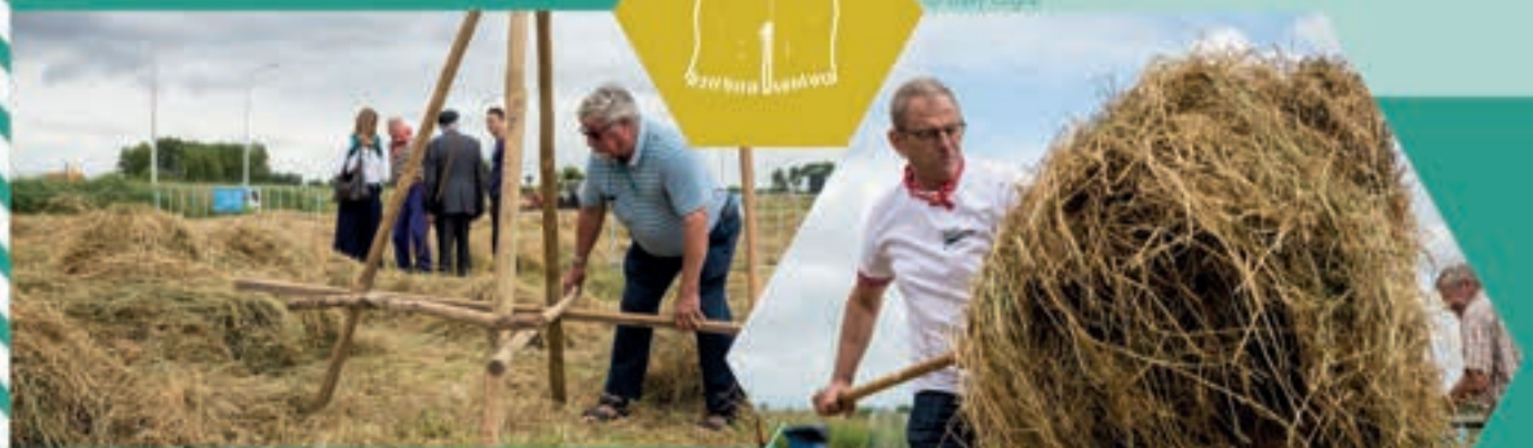
Een haarruder in de maak.