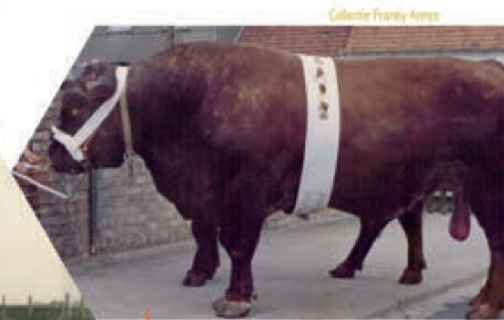
Collectie Franky Jansz