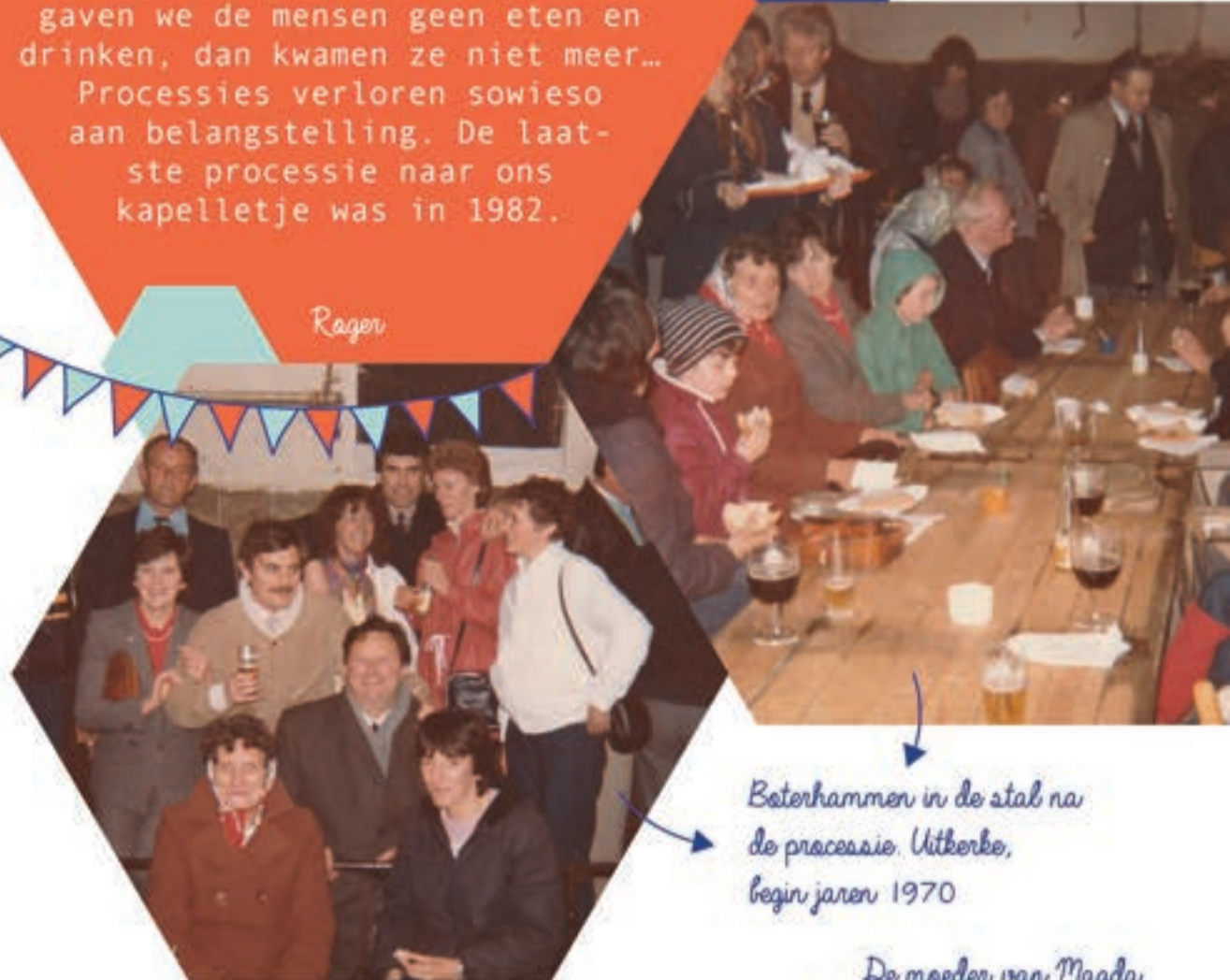
Boterhammen in de stal na de processie. Utkerke, begin jaren 1970