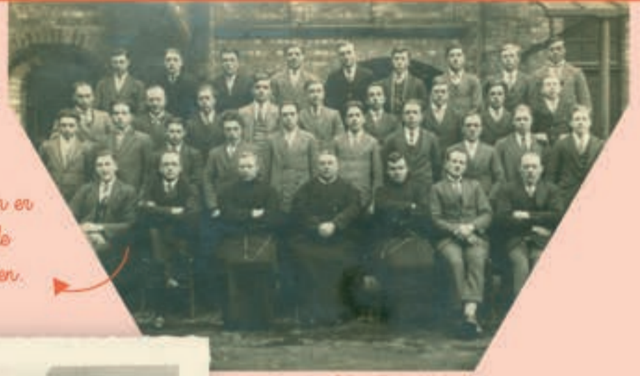
Collectie Westhoek verbeeldt

In 1922 werd de landbouwschool Roeselare opgericht, verbonden aan het Klein Seminarie. Landbouwers in spe konden er vanaf 12 jaar terecht om de kneepjes van het vak te leren. Roeselare, 1925