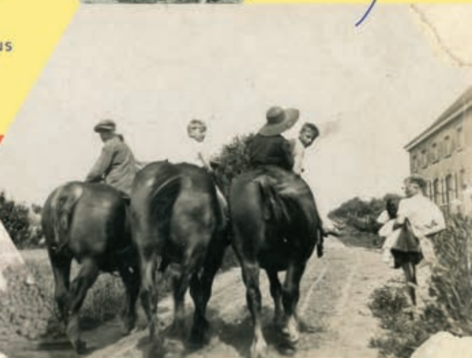
Collectie Willy Vanderberghe