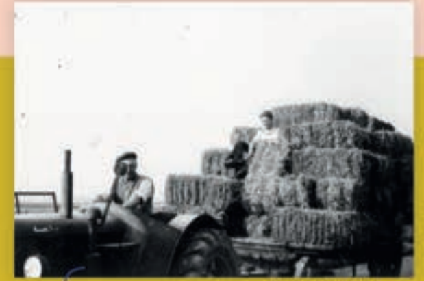
Collectie Magda De Vlamynck

We hadden een boerderijtje in Uitkerke van zo'n 30 ha met een achttal koeien en een varkensstal. We hebben het in 2000 verkocht, maar de band met de plek waar we zo lang boerden is gelukkig niet helemaal doorgeknipt. We hebben er nog een schuur en een grote moestuin! -Rager