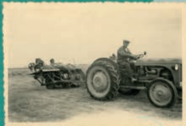
Collectie Willy Van Haecke