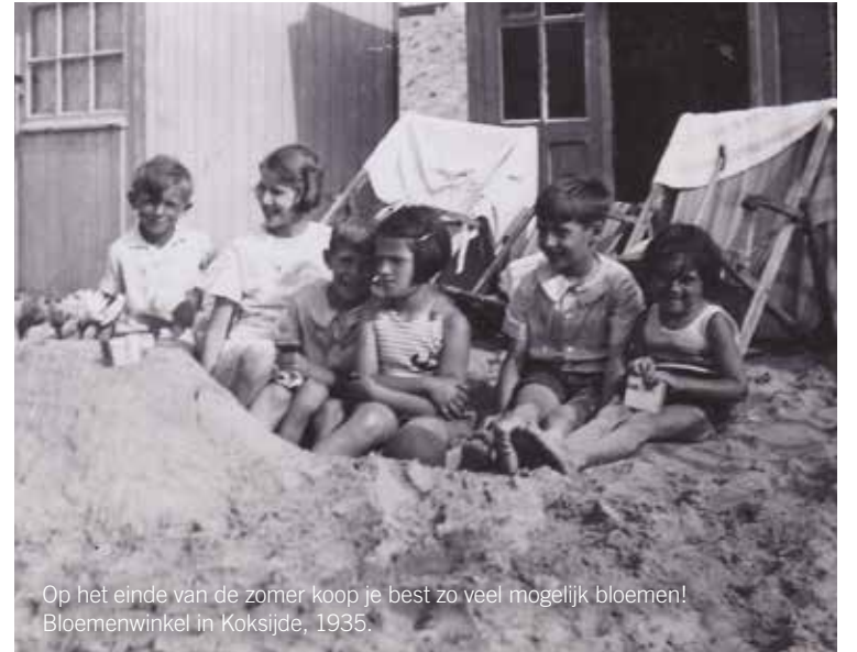
Op het einde van de zomer koop je best zo veel mogelijk bloemen! Bloemenwinkel in Koksijde, 1935.