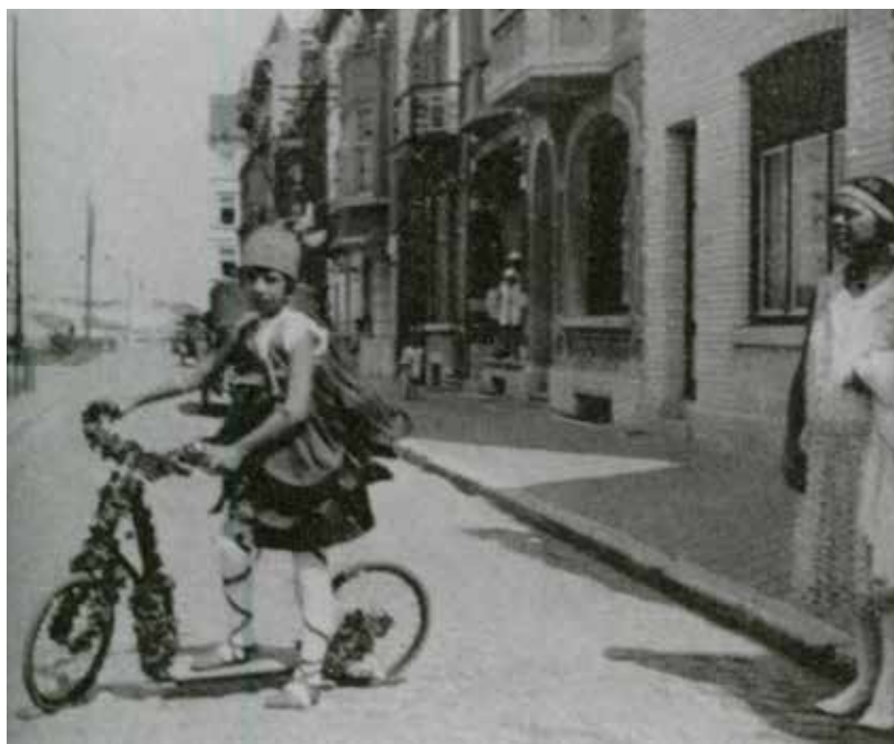
boven: Papieren bloemen in de processie van Mariakerke en de huidige verkiezing van het bloemenkind als opvolger.