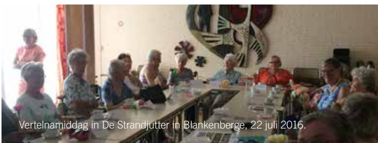
Vertelnamiddag in De Strandjutter in Blankenberge, 22 juli 2016.