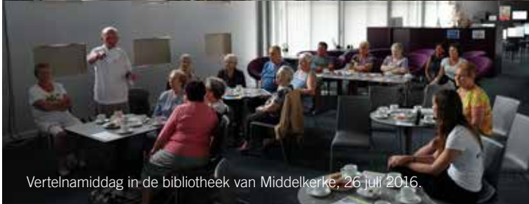
Vertelnamiddag in de bibliotheek van Middelkerke, 26 juli 2016.