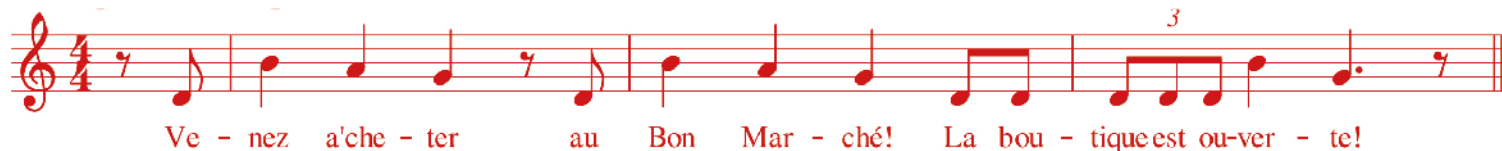
Muzieknotatie van het liedje "Venez acheter au Bon Marché...". In samenwerking met Resonant.

DE LAATSTE JAREN VERSCHIJNEN ER OOK POPPETJES UIT CRÊPE-PAPIER OP HET STRAND. DIT BLIJKT GEEN NIEUW FENOMEEN TE ZIJN. IN DE JAREN 1960 EN 1970 DOKEN DEZE PAPIEREN MANNETJES AL EENS OP: "DE PAPIEREN POPJES WAREN EEN RAGE VOOR EEN JAAR, EN DAN VERDWENEN ZE WEER. EEN PAAR JAAR LATER WAS ER WEER IEMAND DIE DAARMEE BEGON."