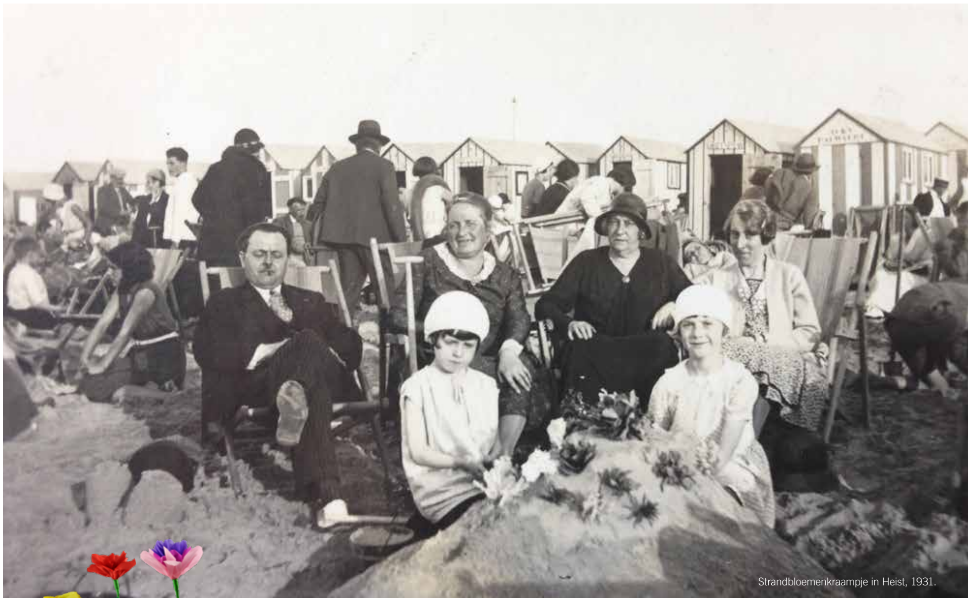
Strandbloemenkraampje in Heist, 1931.